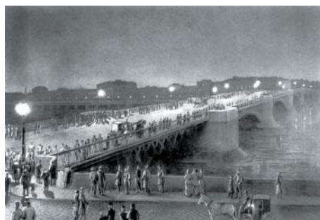
Рис. 7. Пилотный проект «Товарищества электрического освещения П. Н. Яблочкова» по освещению Литейного моста в Санкт-Петербурге, 1879 г.

Этот запас был чем-то само собой разумеющимся и не считался одним из возможных резервов повышения энергоэффективности, который можно использовать, управляя яркостью лампы (теперь это принято называть диммированием). Еще одним фактом, на который, как правило, также не обращали должного внимания, является большой выигрыш в эффективности светодиодных светильников при диммировании по сравнению с любыми другими источниками света. Важно и то, что такое энергоэффективное управление существенно увеличивает срок жизни светильников, и т. д. и т. п. Таким образом, существует целый ряд возможностей, которые в состоянии сократить текущие расходы и продлить