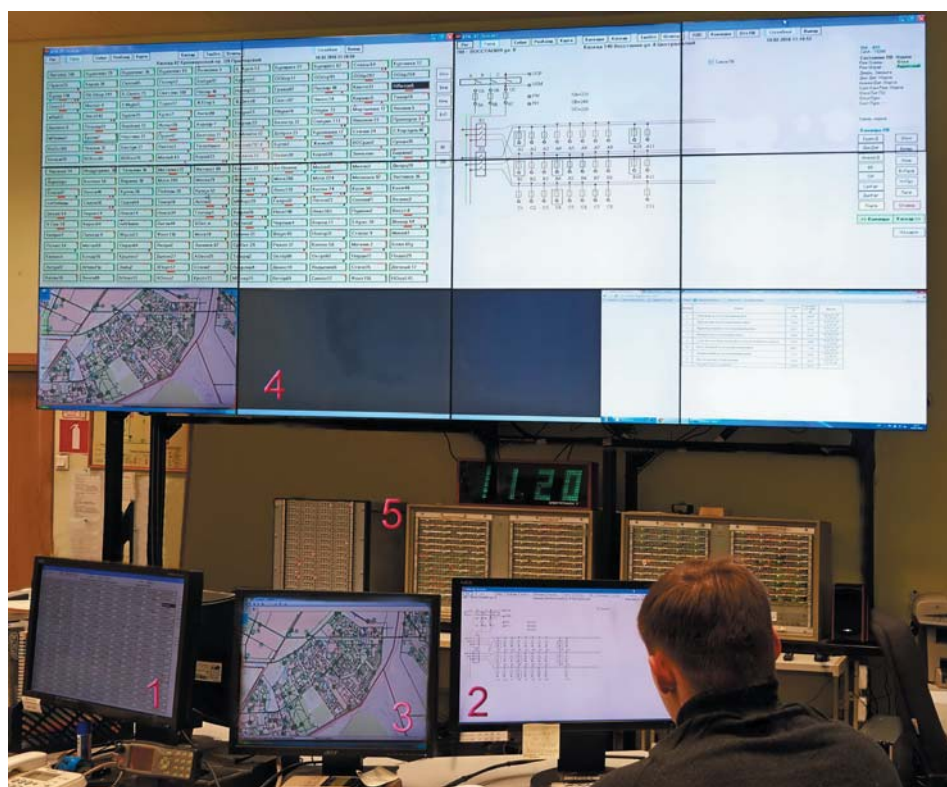
Рис. 6. Аппаратура АСУНО «АВРОРА» на ЦДП ГУП «ЛенСвет» (2016 г.)

Применение новых ламп повлекло за собой только небольшое усложнение светильников. При переходе на ртутные лампы были добавлены дроссели, согласующие вольт-амперную характеристику газового разряда с напряжением сети и ограничивающие стартовый ток на время разогрева, которое могло достигать до нескольких минут. Для натриевых ламп дроссель пришлось дополнить импульсным зажигающим устройством (ИЗУ), создающим мощный киловольтный импульс первоначального пробоя газового промежутка. Дроссель с ИЗУ стали называть пускорегулирующим аппаратом (ПРА). Появление в дальнейшем электронных управляемых ПРА стало, как видится уже из нашего времени, не модернизацией (кстати, не во всем