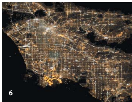
Рис. 8. Освещение Лос-Анджелеса: а) в 2010 г.; б) три года спустя

В нашем случае, как и во множестве аналогичных, проще всего отталкиваться от модного и (как бы) общепринятого критерия соотношения цены и качества. А поскольку требуемые характеристики НО достаточно строго нормированы в руководящих документах (с ранжированием для дорог разной категории), то и критерий упрощается до величины цены, которую следует заплатить за создание и поддержание регламентированных характеристик НО. Очевидно, что исходя из обозначенных интересов нам следует стремиться к минимизации расходов в течение всего жизненного цикла ИНО, поэтому в качестве критерия следовало бы выбрать известную экономическую категорию — совокупную стоимость владения (ССВ). Однако всеобъемлющий расчет по критерию ССВ (англоязычный аналог — Total Cost of Ownership, TCO) за весь жизненный цикл НО весьма сложен, громоздок и вряд ли может быть убедительным, а посему и рекомендованным для использования.