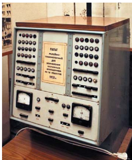
Рис. 5. Релейно-транзисторный пульт управления НО на 10 ПП (разработка 1972 г.)

возможный проводной канал связи в то время. В ПП были установлены приборы релейной автоматики для управления обмотками контакторов, которые коммутировали сетевое напряжение на ЛО. Система обеспечивала одновременное включение и выключение всех светильников крупного города по командам созданного для нее ПУ, который в «Мосгорсвете» прозвали «бериевским» (рис. 4). Увеличенное число каналов управления и, следовательно, ГПП резко снизило вероятность возникновения крупных аварий НО. Для контроля срабатывания всех контакторов в каскаде, были проложены специальные «обратные» провода от конечных ПП к приборам релейной автоматики ГПП. Приборы определяли наличие на них напряжения и выдавали закодированный сигнал в ПУ по той же управляющей телефонной линии.