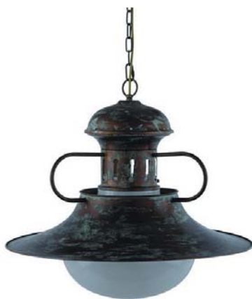
Рис. 3. Зонтичный светильник

Первым мегаполисом, для которого была разработана такая система, стала Москва. Характерно, что реализация инновационного управления шла параллельно с модернизацией НО, которая заключалась в замене старых типов светильников (типа «зонтичных», представленных на рис. 3), создающих большую неравномерность освещения дорожного покрытия, на светильники с зеркальными отражателями (аналогичные современным светильникам, показанным в начале статьи). Новые светильники имели кривую силы света (КСС) типа Ш (широкую) и благодаря этому обеспечивали гораздо лучшую равномерность освещения дорог при больших расстояниях между опорами НО. Настоятельная необходимость такой комплексной модернизации была вызвана интенсивной автомобилизацией страны