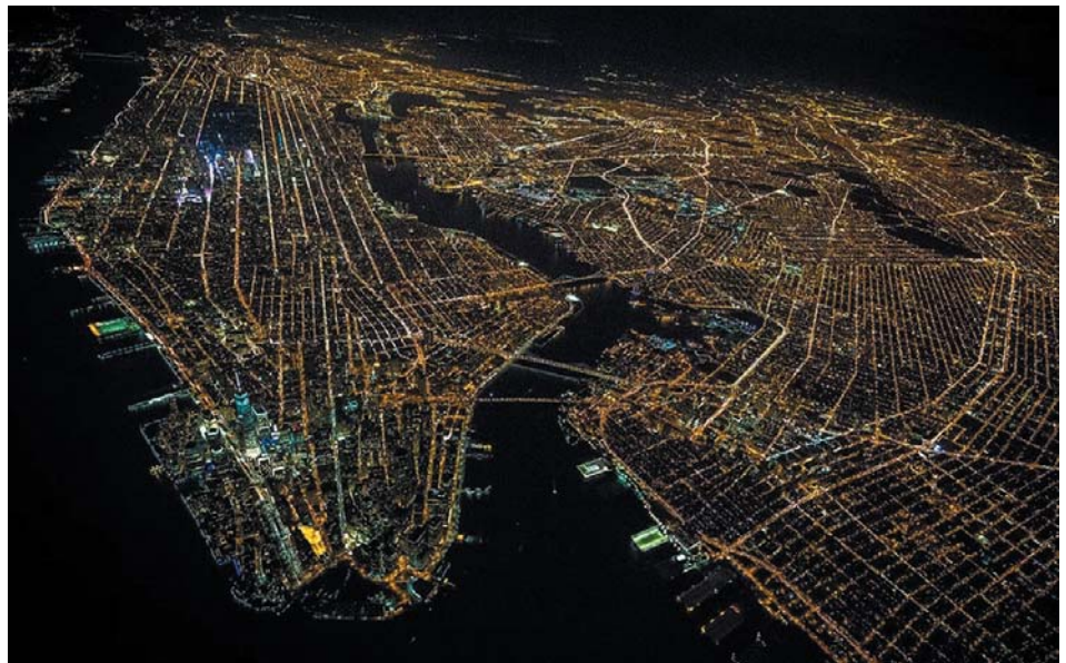
Рис. 1. Современное освещение Нью-Йорка (2012)

Электрические сети наружного освещения с началом экономического подъема