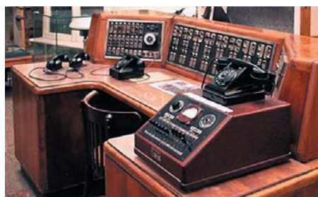
Рис. 4. Пульт телеуправления НО Москвы, конец 1930-х годов (музей «Огни Москвы»)

Телеуправление ПП в системе НО Москвы осуществлялось по выделенным (постоянно подключенным) линиям городской телефонной сети (так называемым «телефонным парам»). Этот был единственно